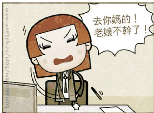
昔 以前和公司嗆聲，被大家當作英雄