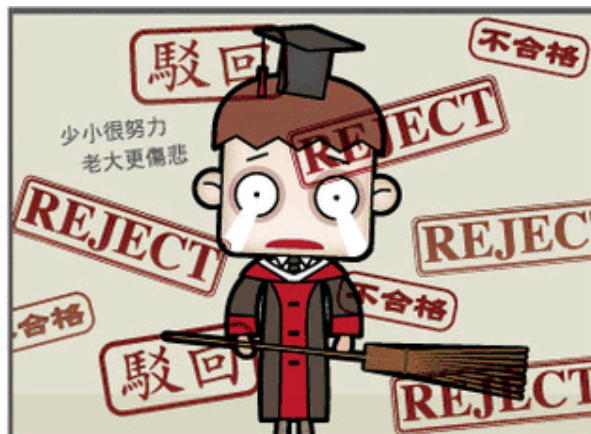
今 現在的清潔工作，連博士都搶破頭