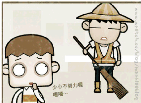
昔 以前的清潔工作，被視為沒前途