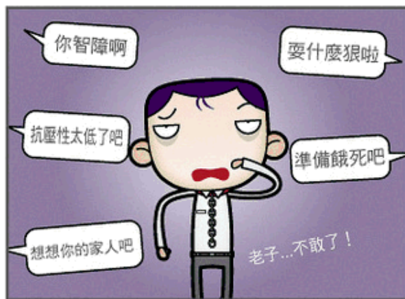
今 現在和公司嗆聲，會遭親友唾棄