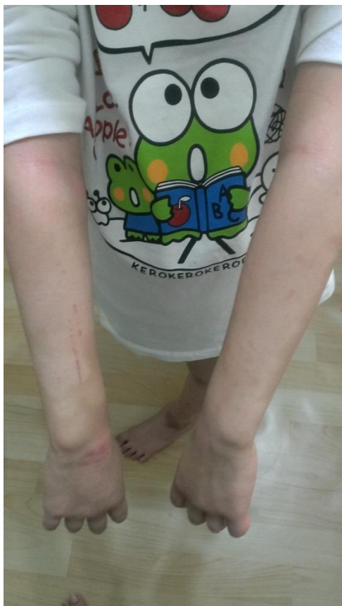
右手關節處，也是抓傷及疹子。